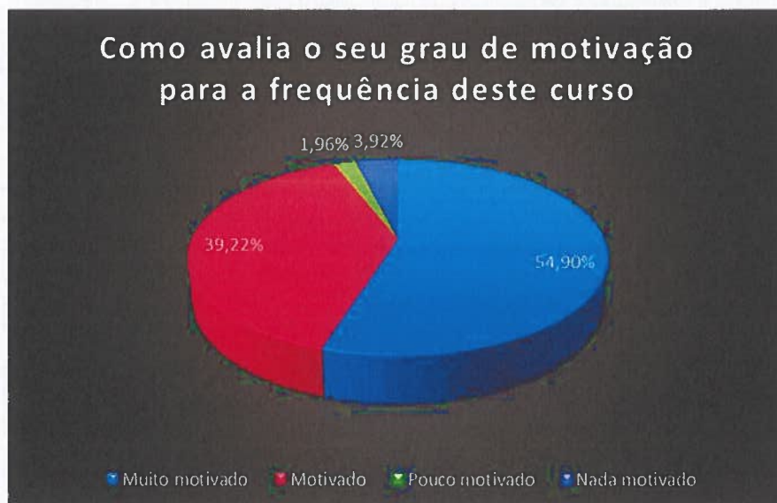
Figura 9 - Grau de motivação - n.º e percentagem de alunos

À entrada do ciclo de estudos, 94,12% dos alunos afirmaram sentir-se motivados ou muito motivados para a frequência do curso. O relatório completo pode ser consultado na página da EPACSB, https://epacsb.pt/informacoes_stakeholders.php , em “Relatórios de Satisfação”, “Alunos” e “Relatório dos Alunos à entrada do ciclo”.